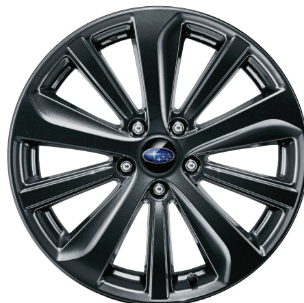
18" легкосплавные диски