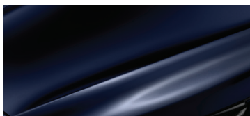
ТЕМНО-СИНИЙ ПЕРЛАМУТ (DARK BLUE PEARL)