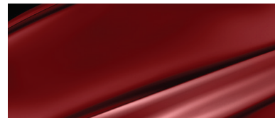
ТЁМНО-КРАСНЫЙ ПЕРЛАМУТ (CRIMSON RED PEARL)