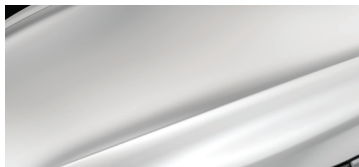
БЕЛЫЙ ПЕРЛАМУТ (CRYSTAL WHITE PEARL)